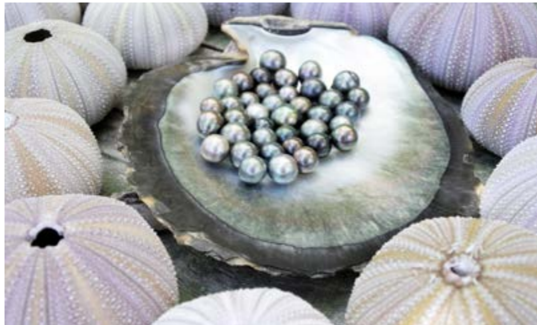
Perles de Tahiti